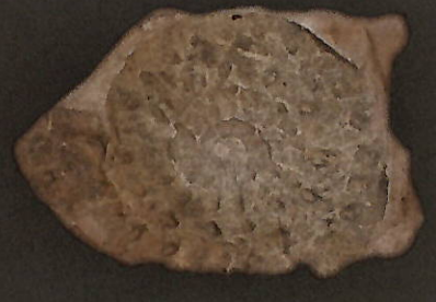
2. 今帰仁層産アンモナイト化石等 2億年以上前の海で 生きていたアンモナイト