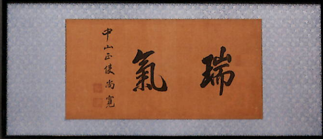
四国初「江戸立ち」伝える 発見資料 1. 尚寛筆「瑞気」