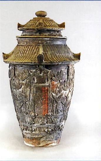
3. マンガン掛け焼き締め庇付き 厨子 数ある厨子甕でも珍しい 赤文字