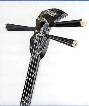
4. 黒漆螺鈿三線 螺鈿の昇龍きらめく至極の 三線

前年度に寄贈・収集・購入・移管・修理された諸資料を一堂 に集め、広く一般に公開するとともに、今後の展示や研究等に 活用することを目的として実施しています。