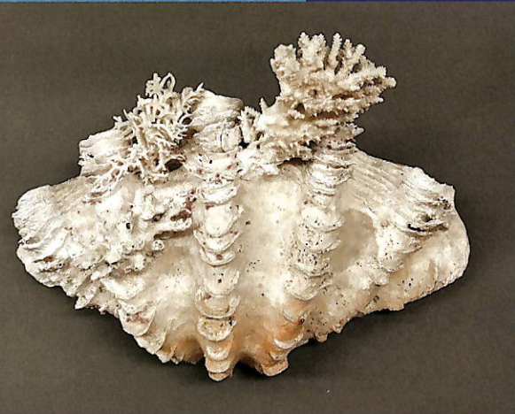
5. ヒレジャコ貝殻標本 庄巻ノ40センチ最大級の巨大な貝