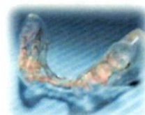
マーテルマウスピース

最先端のコンピューター「メatron」により細胞の活性度を解析し、血流状態、髄液循環状態を把握することが可能になりました。難病、原因不明とされるメニエル、めまい、耳鳴りの多くが髄液循環障害を伴うことが判明。多くの改善例を交え、その他最新健康情報も満載の内容となります。