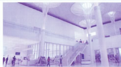
エントランスホールでコンサート!

でもらい、館内活用の可能性を見出すために、エントランスホールにおける「館内定期コンサート」の企画に至りました。コンサート目的としては、エントランスホールでのミニコンサートを定期的に開くことにより、幅広く一般県民の方々に呼びかけることが出来る。多くの方々に足を運んで頂く機会を提供することが出来る。また、コンサートを聞くことを目的に来館いただいた方々にも県立博物館・美術館の素晴らしい企画展や展示室に気づくチャンスをつくり、リピーターとしての入館者になることが期待